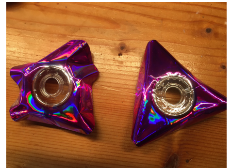
Rückseiten; die Formen entstehen zufällig.

Nicht alle CD's und DVD's geben die gleiche Farbe. Es ist aber schwierig abzuschätzen, welche Farben sie erzeugen und auch die Form ist eher zufällig. Es kann auch mal sein, dass sich die beiden CD's nicht so gut ineinander verschmelzen. Auch da gilt, einfach ausprobieren.