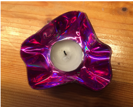
Hier mit zwei CD's; Vorderseiten.