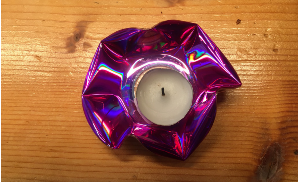
Hier mit nur einer CD; Vorderseite.